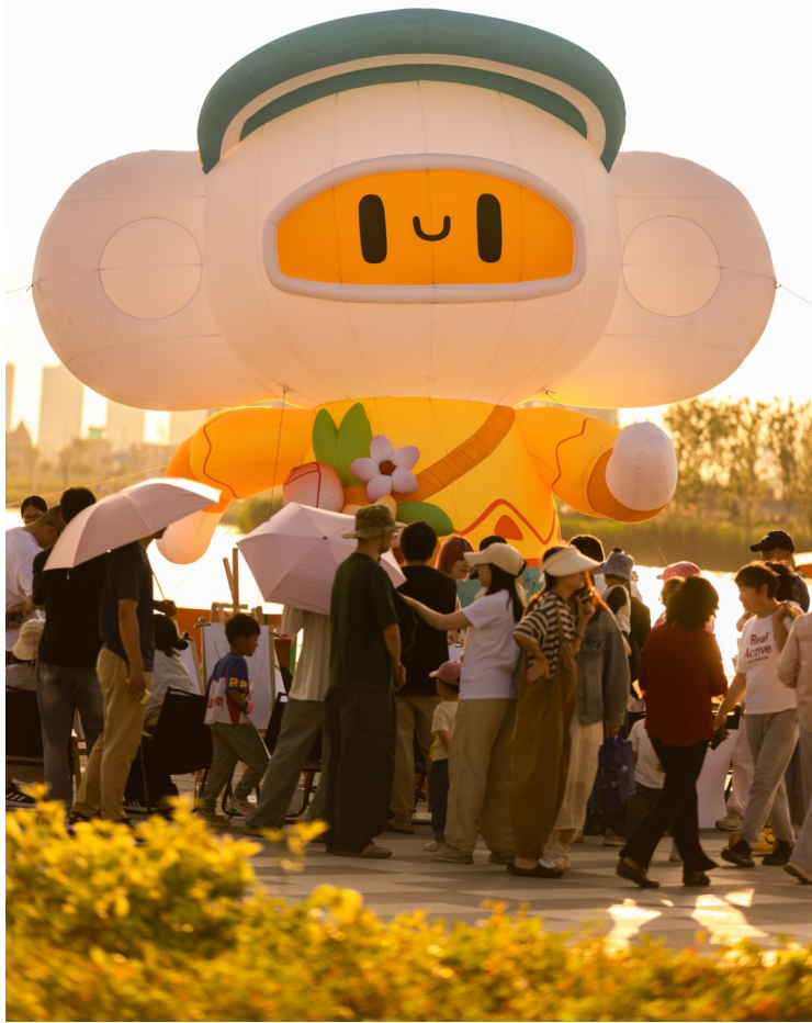
东沙湖公园形象IP“橙小野”

假日期间,东沙湖公园假日旅游专线让八方游客在便捷出行中感受这座城区的温度与魅力,留下美好的钱塘记忆。未来,东沙湖公园将继续挖掘东沙湖生态与人文资源,推出更多创新文旅活动,为市民游客带来更具特色的游玩体验,持续擦亮钱塘文旅新名片。