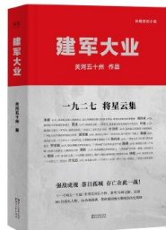
《建军大业》 作者:关河五十州 浙江文艺出版社 出版年:2017-6

作者在书中既有端庄大气的历史讲解,也有战争场面细致入微的描画;既有当时国共两党在路线与方针上的分歧与纷争,也有革命武装与反革命武装在正义与非正义间的博弈与对垒。历史的大幕,不时解映着革命先驱为了新中国的创立,抛头颅、洒热血的英勇身影;也不时在我们的耳畔,响彻起多少志士仁人,在白色恐怖下为了追求民主与光明,而迸发出的惊世誓言。历史没有忘记,在风云激荡的近代中国,中国的工农武装因为有了中国共产党的领导,从此,中国革命便展开了崭新的画卷。《建军大业》透过斑驳的历史烟云,以极强的纵