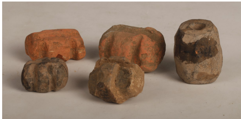
河庄蜀山采集的陶网坠