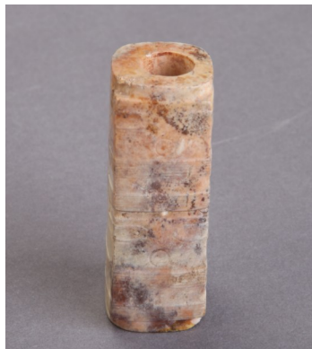
河庄蜀山采集的小玉琮