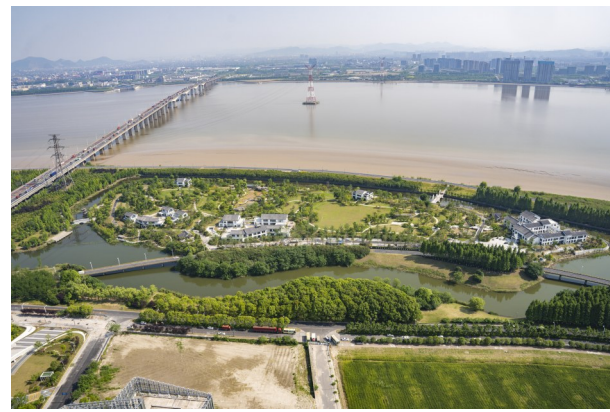
沿江公园西景观亮灯工程

本项目针对五栋管理用房及亭台楼阁水榭进行亮化，增加互动装置及灯光小品，设置小型及中型音乐表演喷泉四处。该亮灯工程完成后，将进一步提升沿江板块的夜景景观效果。