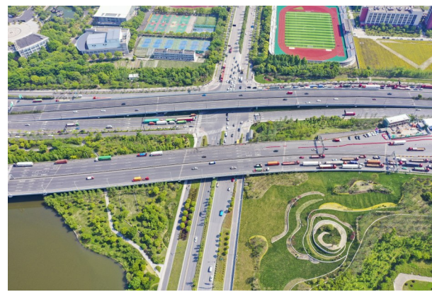
下沙东互通景观提升工程

景观提升范围为下沙东互通区块，德胜快速路及文海路两侧绿化带，针对现场情况将本次景观提升工程划分成两种整改类型：核心重点提升类型、市政公园整改类型。