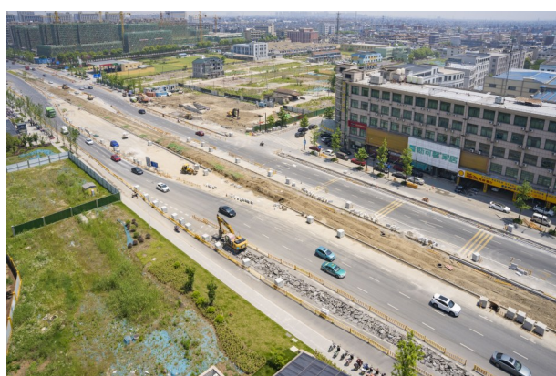
地铁站周边道路景观恢复工程(7号线)

项目位于义蓬街道、河庄街道，主要包括地铁7号线(靖义区间2#风井站、义蓬站、塘新线站、北二路站、江东二路站、义盛河桥、小泗埠桥、小泗埠横湾河桥)的道路工程、部分管线工程、景观绿化、道路附属工程等修复。