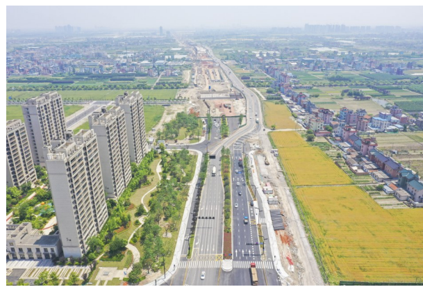
江东大道提升改造工程

江东大道二期工程西起滨江二路西段，东至河庄大道，路线全长约2.4公里。三期工程西起青六路东，东至苏绍高速，路线全长约5.62公里。道路设计等级为城市快速路，二期采用“高架快速路+地面快速路”建设形式，三期采用“地下隧道快速路+地面快速路”设计形式。