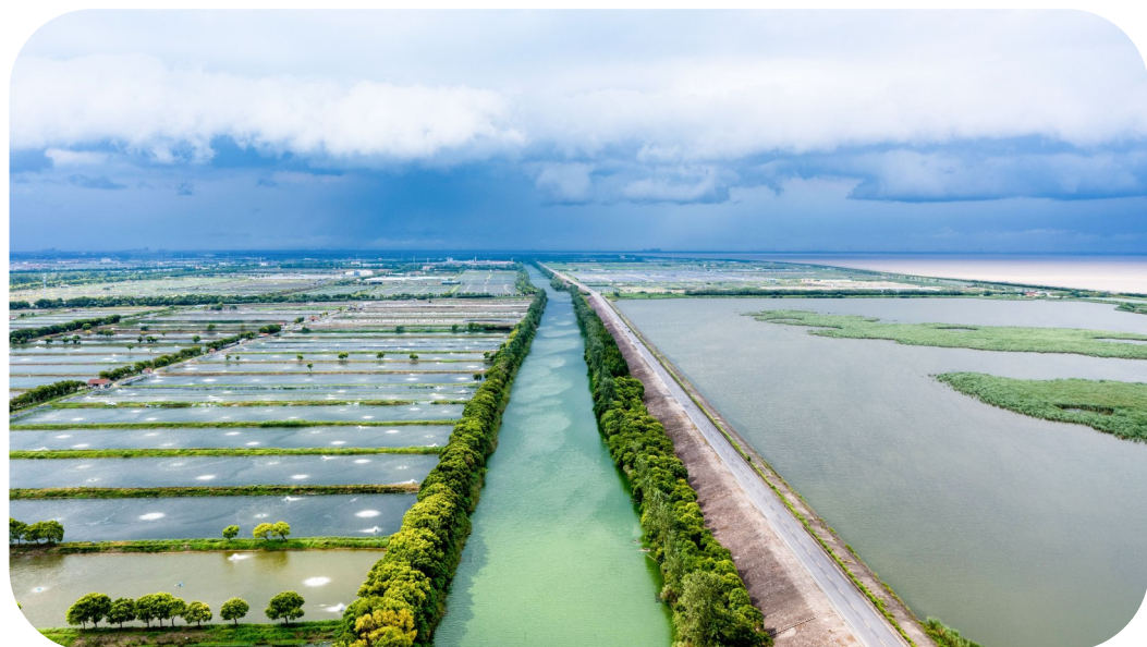
一边是湿地湖链,一边是农田景观,组成了充满钱塘韵味的生态文明。马哈聪 摄

钱塘区找准工业污染源,打击环境痛点,开展专项整治工作,着力践行“蓝天保卫战”行动。“十三五”以来,钱塘区淘汰改造各类燃煤锅炉163台,完成结构关停重污染企业47家,“散乱污”整顿关停100余家,整治提升VOCs企业181家,恶臭异味治理37家,累计淘汰国三柴油车2073辆。