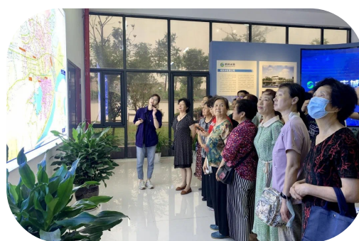
组织市民参观钱塘生态公园

接下来,我区将持续推进水质提升攻坚战、污水零直排攻坚战等治水任务,从单纯的水质提升向提升水健康、打造水文化转变,向幸福河湖升级转变。