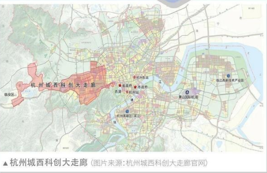
▲杭州城西科创大走廊