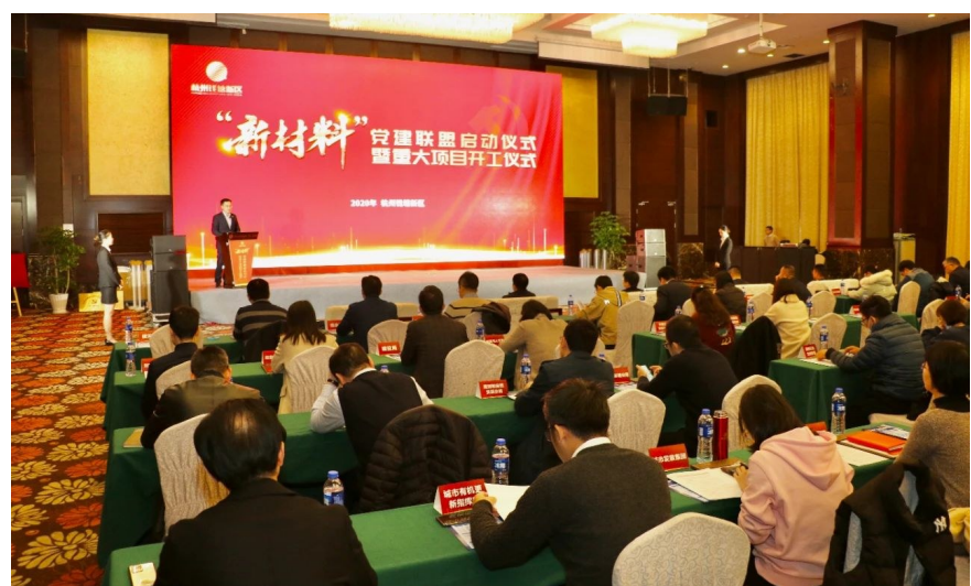
钱塘区“新材料”党建联盟启动仪式

“整合产业资源，汇聚红色力量，启动‘新材料’党建联盟，将充分发挥‘新材料’产业联盟的集群效应，以企助企促进合作共赢，抱团发展，形成园内企业协同合作机制。”平台相关负责人表示，党建引领下，平台通过举办“党建赋能发展”